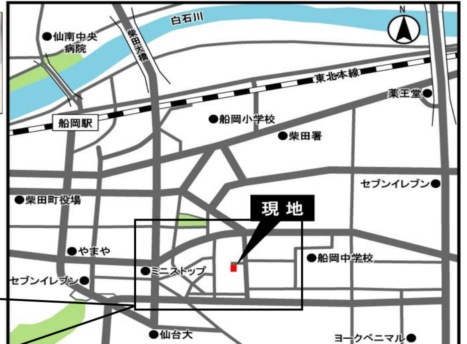
※ 現地には、指定駐車場がございますので現地スタッフにお声掛けください。