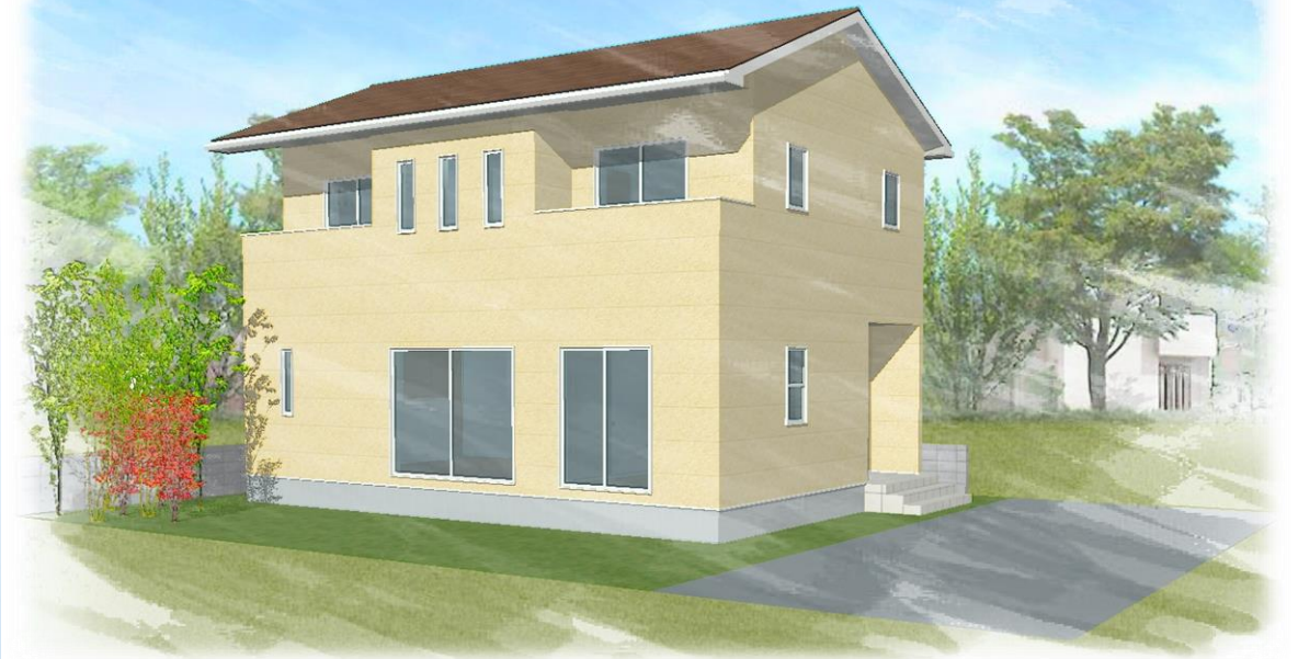
※本内覧会は、施主様のご厚意によって開催されます。

漆喰壁を思わせるコテ塗り風デザインの外観と、グラデーションが織り成す屋根材リッジウェイとのコラボで南フランス「プロバンス」を漂わせる雰囲気